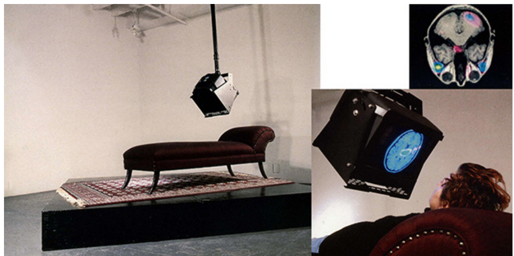
Abb: 2 >